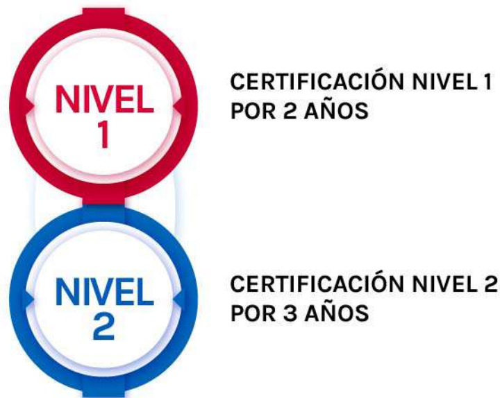
Ilustración 3: Años de duración del certificado.

El estándar, es una herramienta flexible que permite al productor de aves elegir la duración de la certificación. Así, los planteles que logren demostrar cumplimiento de los requisitos fundamentales accederán a una certificación Nivel 1 , la cual será válida por un periodo de 2 años. Aquellos planteles que además, demuestren el cumplimiento de los requisitos adicionales, accederán a una certificación Nivel 2 , cuya vigencia se extenderá por un periodo de 3 años.